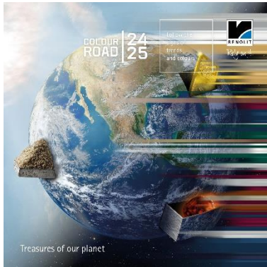
Motiv „ RENOLIT_Colour_Road “

Unter dem Titel „Treasures of our planet“ steht der Trend Report 24|25 der RENOLIT Colour Road.