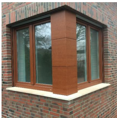
Motiv „ RENOLIT_BENDIT “

Mit der Kaschierfolie RENOLIT GEOFOL FH eröffnet das Unternehmen neue Designmöglichkeiten für Bodenbelege im Außenbereich.